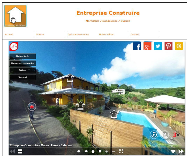
Figure 2 : Home page site WEB d'ENTREPRISE CONSTRUIRE

ENTREPRISE CONSTRUIRE acteur clé du BTP sur les Antilles françaises et la Guyane reconnaissable à son logo en forme de flèche élevée vers le haut, assimilable à une maison, doté du symbole 'interaction digitale', annonce la disponibilité de son nouveau site Web : www.entreprise-construire.fr accompagné d'une présence remarquable sur le NET dans les principaux réseaux sociaux dont Twitter , Facebook , Google+ et son BLOG .